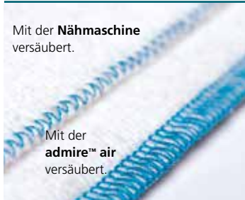
Mit der Nähmaschine versäubert.

In Windeseile schneidet die PFAFF® admire™ air 5000 den Stoff an der Kante ab, näht und versäubert die Naht in einem Nähvorgang. Mit ihr verarbeiten Sie schnell und perfekt Stoffe wie zum Beispiel Sport-, Strick-, Jerseystoffe oder Organza. Das Plus an Komfort ist die innovative Lufteinfädung der Greiferfäden. Nie war Einfädeln einfacher.